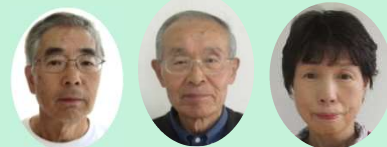
講師：里山プロジェクトガイドのみなさん